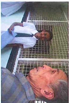
2011年スリランカ里親ツアー 里子と里親の対面

経済的に厳しい家庭では、子ども達が未だ労働力とみなされることもあり、高等教育への進学は厳しさがありません。奨学金の存在は、子どもの学ぶ環境づくりに大変役に立っています。